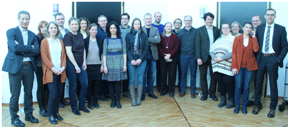
Mitglieder und Gäste der Aktionsgruppe 9, Action Group Forum im Februar 2017